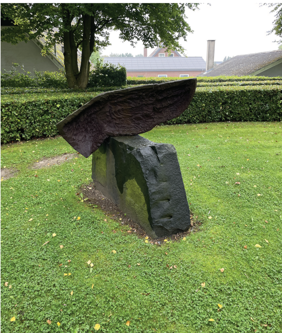
Kunsten på kirkegården