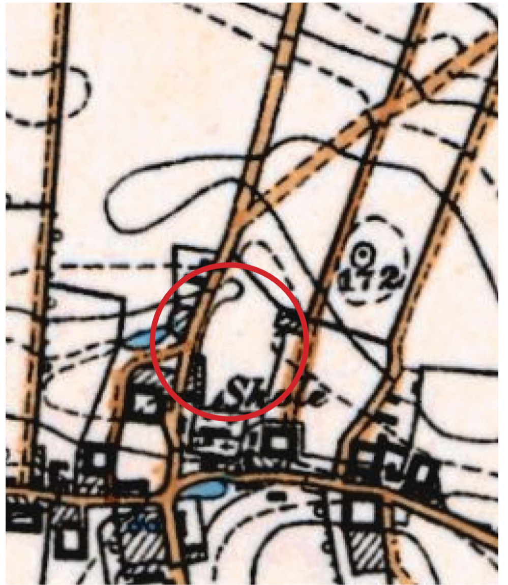
Kort høje målebordsblade - 1870-1899