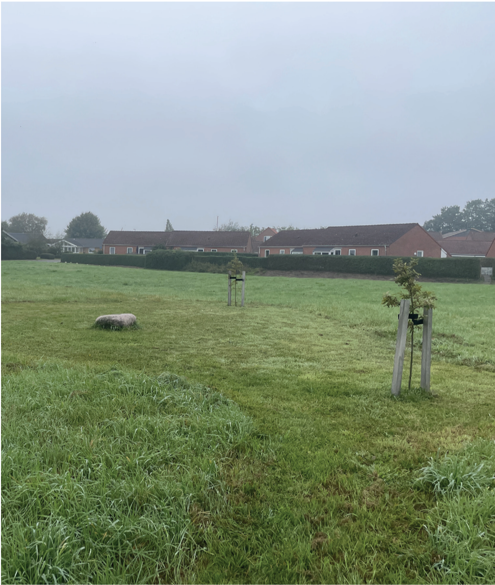
Åbning i byens rum