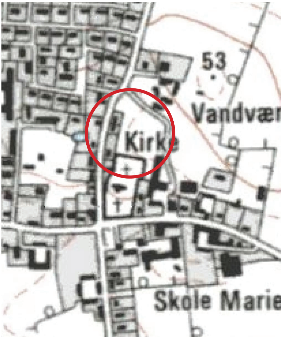
4 cm kort 1980-2001