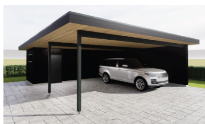
Figur 2 - Visualisering