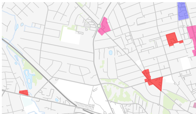
Figur 1. Detailhandelsafgrænsningen i Kommuneplan 2021

Antallet af tomme butikslokaler i bymidten optælles jævnligt. I de seneste fire år er antallet af tomme butikslejemål faldet betragteligt, hvilket er væsentligt, da et levende handelsliv bidrager til en levende by. Den første opgørelse af tomme lejemål i foråret 2018 viste 58 tomme lejemål indenfor centerringen. I efteråret 2021 var tallet nede på 39. Tallene viser dermed en positiv butiksudvikling i midtbyen.