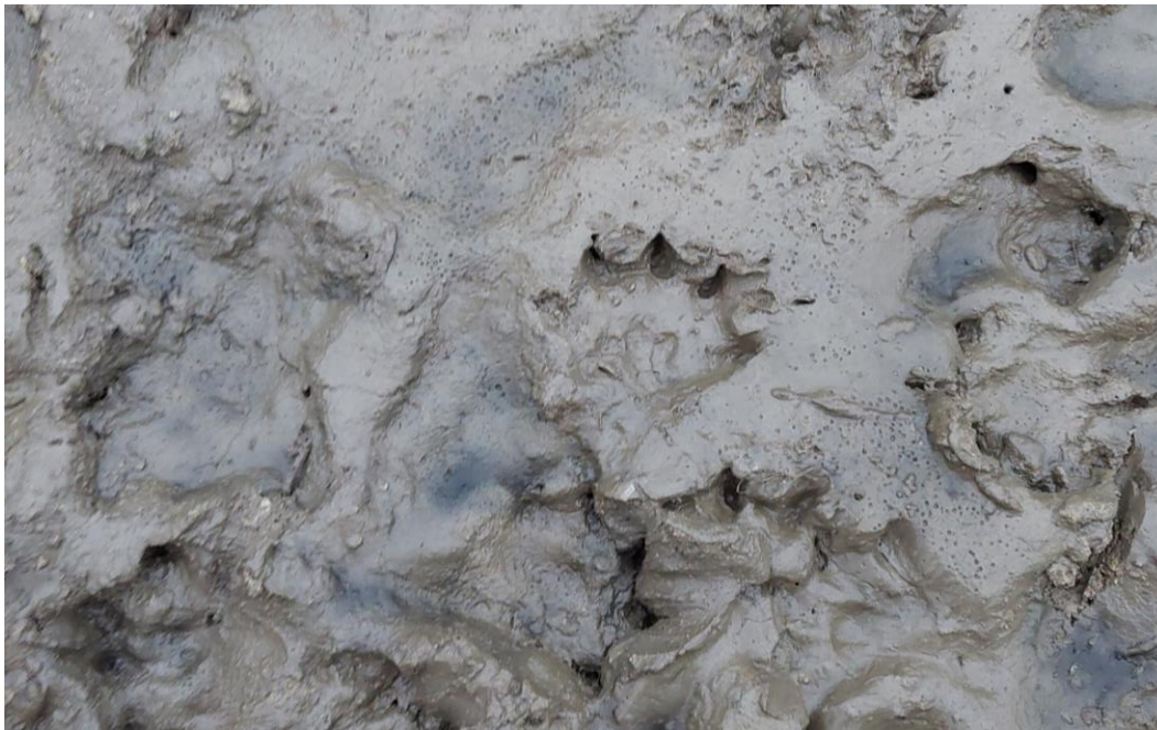
Fodsporet fra odderen er kendetegnet ved fem fingre, korte kløer og svømmehud.

Efter åen er begyndt at løbe igen, har vi set fodspor fra odder, fisk i det nye åløb, og der er også blevet set en isfugl.