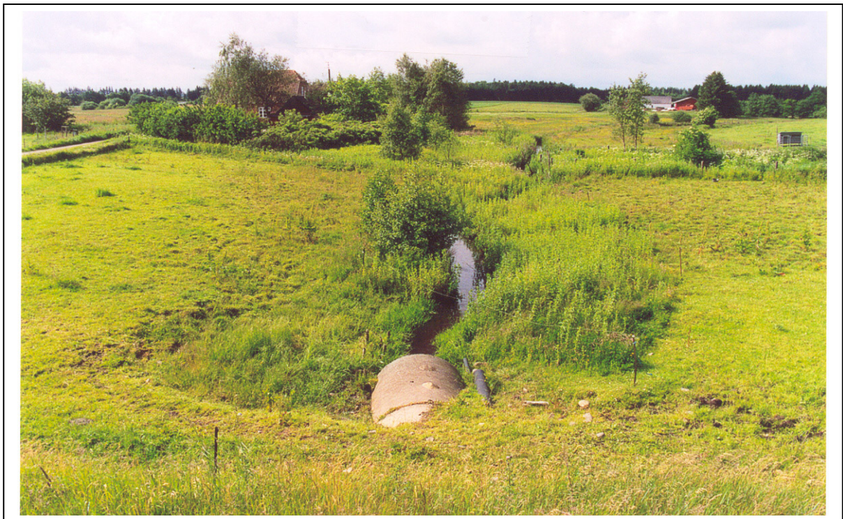
Figur 3. Samme vandløbsstrækning som i fig. 1 og 2 efter 8 års hegning.