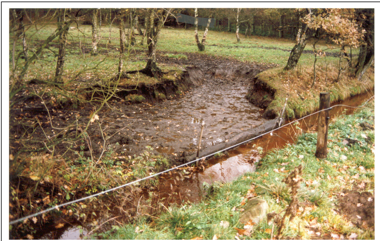
Figur 8. Viser et tilfælde hvor højdeforskellen mellem markens niveau og vandoverfladen i bækken, har været for stor. Dette har medført en stor erosion trods den faste forkant.

Hvis området ned imod vandløbet hælder for meget, eller hvis højdeforskellen mellem marken og vandoverfladen er for stor, vil en fast forkant på vandingstedet ikke hjælpe meget. Store mængder materiale vil til trods for den faste forkant alligevel blive transporteret ud i vandløbet, se figur 8.