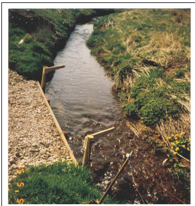
Figur 7. Som i fig.6.