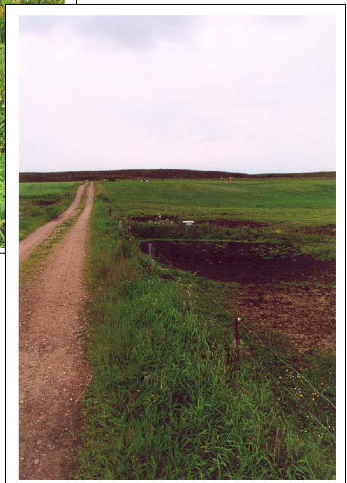
Figur 15. Samme vandløbslokalitet som i figur 14. Efter etablering af afhegning har vandløbet retableret sig ganske smukt, nærbillede af lokaliteten ses i fig.15a.