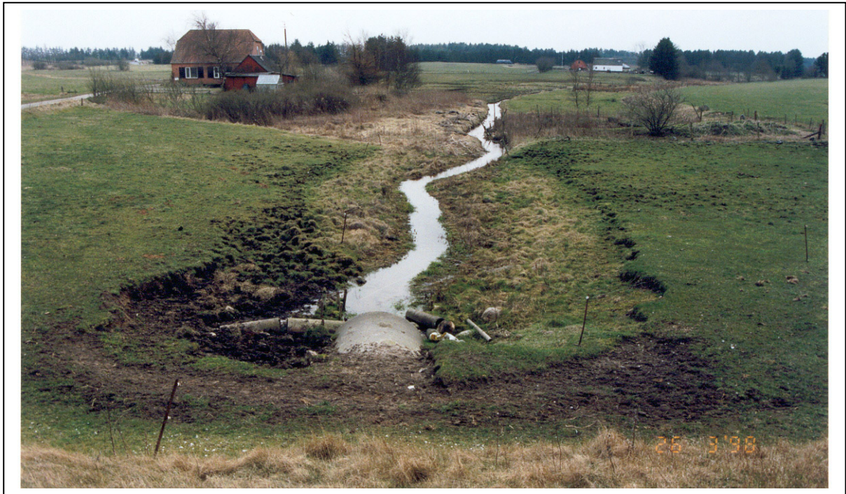
Figur 2. Samme vandløbsstrækning som i fig. 1, 4 år efter at der er foretaget en afhegning, bemærk indsnævringen af vandløbsprofilen.