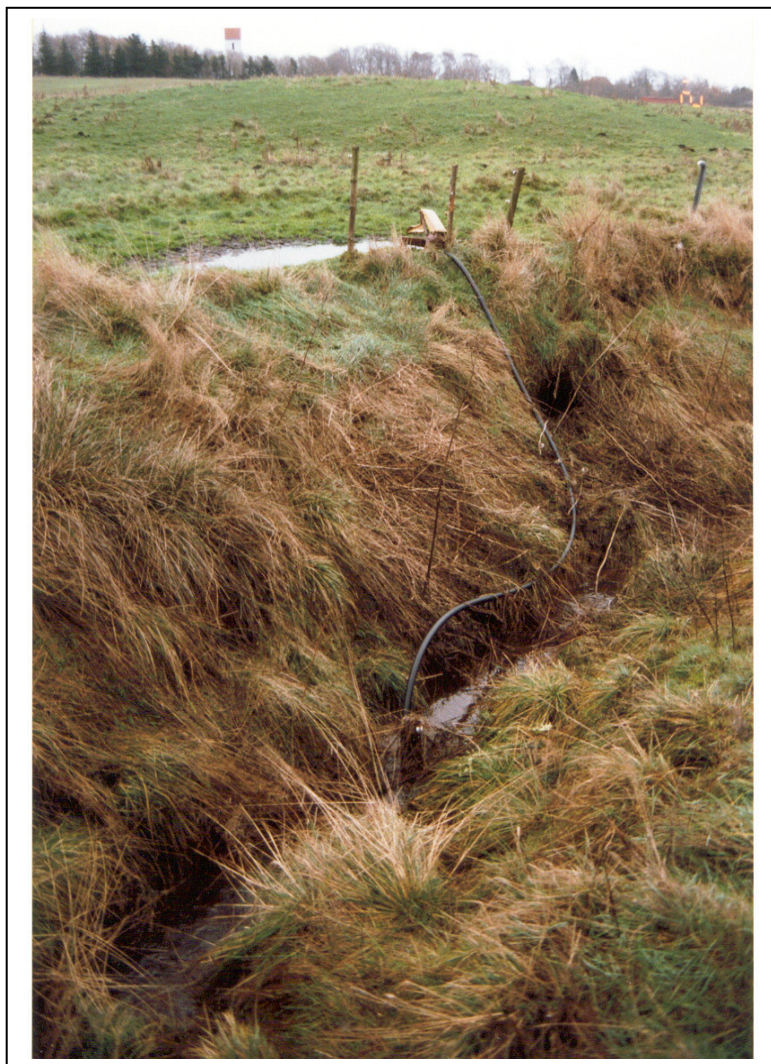
Figur 10. Viser en mulepumpe, der henter vandet op på et sted hvor niveauforskellen mellem marken og vandoverfladen i vandløbet er på min. 2 meter.

Det vil være en god ide, at fastgøre indsugningsslangen til en synlig, solid pæl i vandløbet, på denne måde sikres indsugningsåbningen imod tilstoppelse, og ved vedligeholdelsesarbejder bliver man opmærksom på hvor slangen ligger. Den vinddrevne vandpumpe er sammen med et vandreservoir (badekar eller lign.) også en hensigtsmæssig måde, at bringe vand op til dyrene. Dog må vindmøllen ikke anbringes som vist på figur 11, idet den herved kan være i vejen ved vedligeholdelsesarbejder. Vindmøllen skal være anbragt fri af vandløbet.