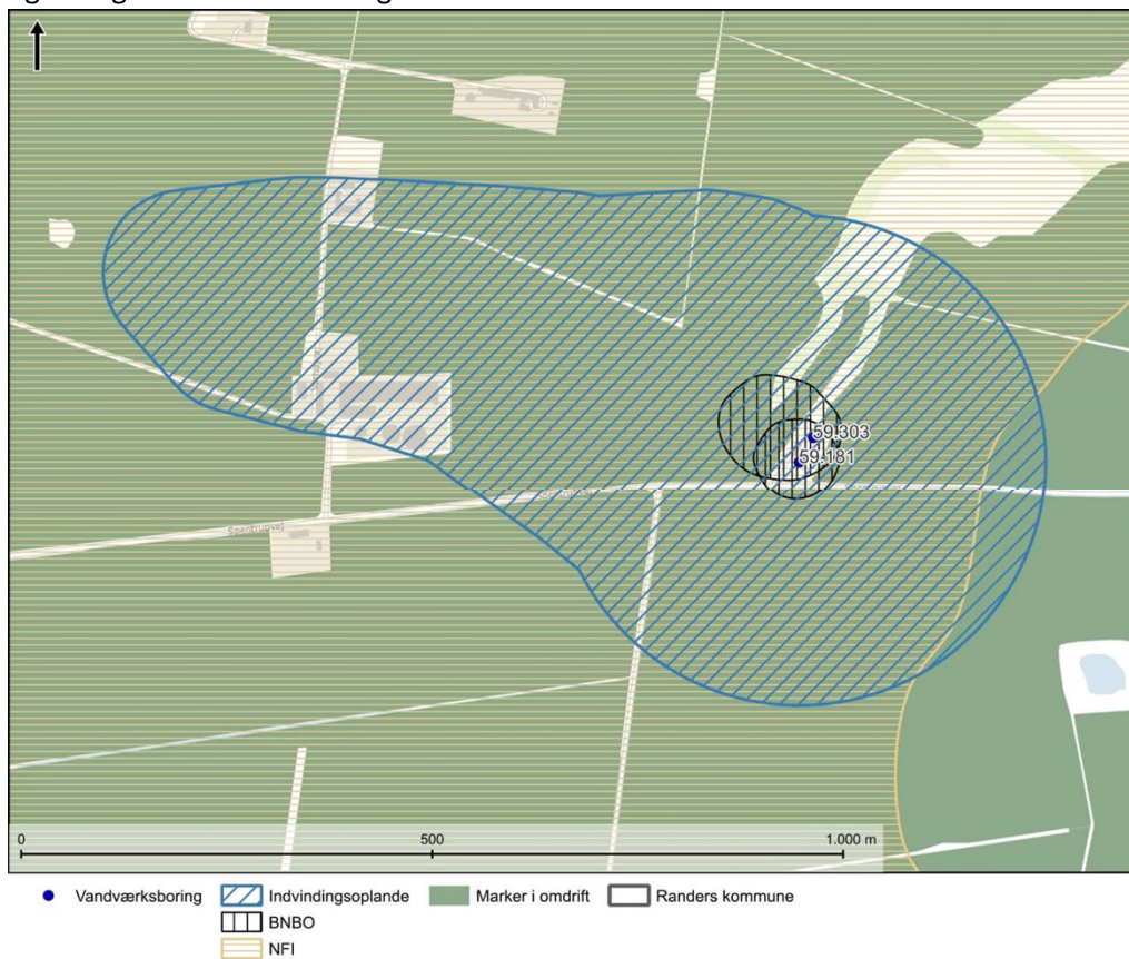
Figur 1 Indvindingsopland, BNBO, nitratfølsomme indvindingsområder, dyrkede marker, øvrige indvindingsboringer og forureningslokaliteter (der er ingen forureningslokaliteter).

Randers Kommune skal på baggrund af en risikovurdering gennemgå hvilke grundvandsforurenende trusler, der foreligger indenfor indvindingsoplandet, samt om rå- eller rentvand udviser tegn på ukendte forureningskilder. Resultatet herfra benyttes til, at præcisere vandværkets kontrolprogram, så alle drikkevands kvalitetskrav overvåges og overholdes. På figur 1 ses indvindingsoplandet til Hald By og Omegn Vandværks boringer.