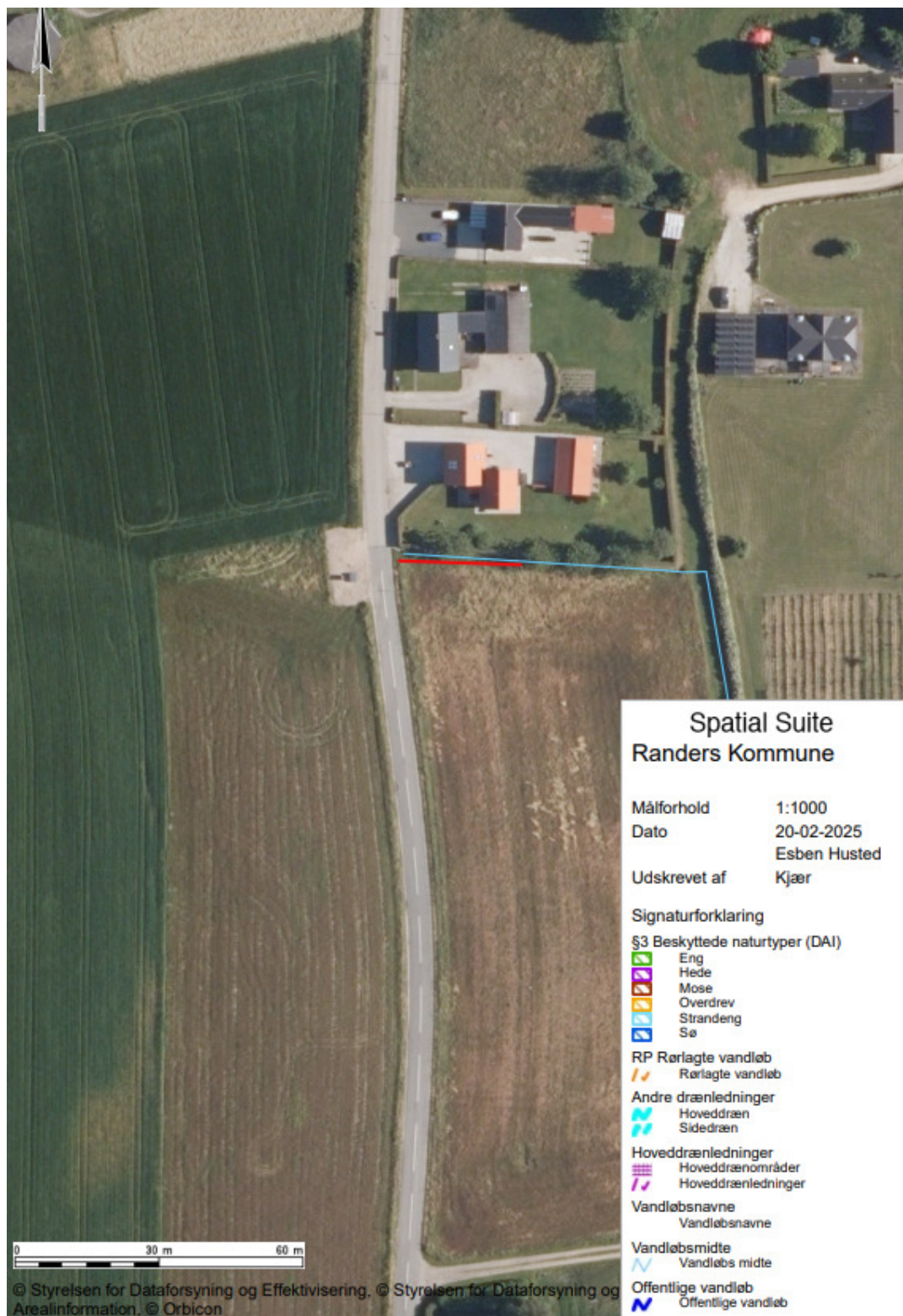
Figur 2 Strækning på 35 m der søges rørlagt, er markeret med rød linjeføring strækningen opstrøms er i dag rørlagt.