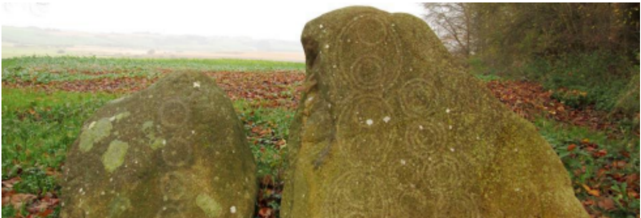
Ved Vandmøllevej i udkanten af Øster Velling Skov står to granitsten med indhuggede cirkelmønstre fra bronzealderen. I dagslys er det så godt som umuligt at se helleristningerne. Der er derfor brugt billedmanipulation for at illustrere, hvordan stenene oprindeligt har taget sig ud.

Her kan man se de indhuggede geometriske cirkelmønstre fra bronzealderen. En fredningssten i granit markerer stedet. De to såkaldte helleristningssten står nær deres oprindelige plads.